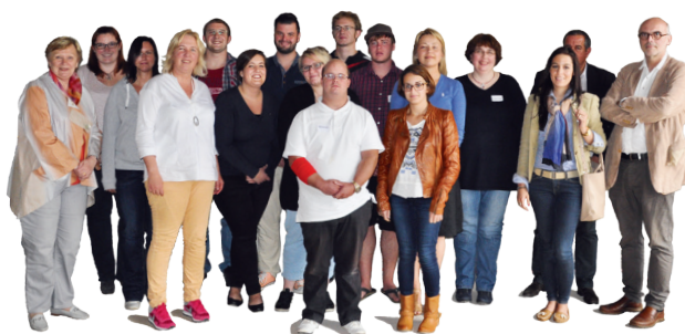
Fundação do grupo Survivor, julho de 2014