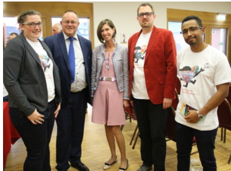
Présentation de la brochure d'information "Survivors informent les jeunes atteints d'un cancer"